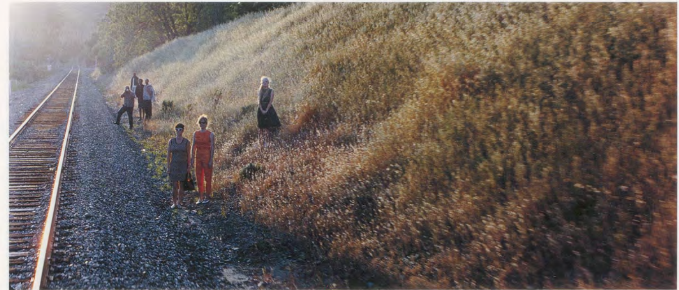
PHILIPPE PARRENO, JUNE 8, 1968, 2009, film stills, 70 mm film, approx. 8 min. / 8. JUNI, 1968, Filmstills, 70-mm-Film, ca. 8 Min.

LUC LAGIER ist Filmkritiker und Autor von Mille yeux de Brian De Palma (Editions Cahiers du cinéma, 2008) und Regisseur von Dokumentarfilmen, zuletzt Nouvelle vague, vue d'ailleurs (Arte, 2009).