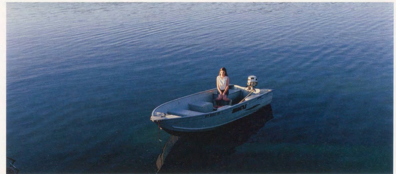
PHILIPPE PARRENO, JUNE 8, 1968, 2009, film still / 8. JUNI, 1968, Filmstill.