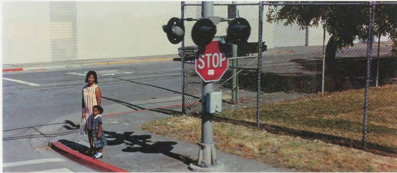
PHILIPPE PARRENO, JUNE 8, 1968, 2009, film still / 8. JUNI, 1968, Filmstill.

laubt hätten, wesentliche Fragen zu beantworten: Wer hat geschossen, von wo, und wie viele Male?