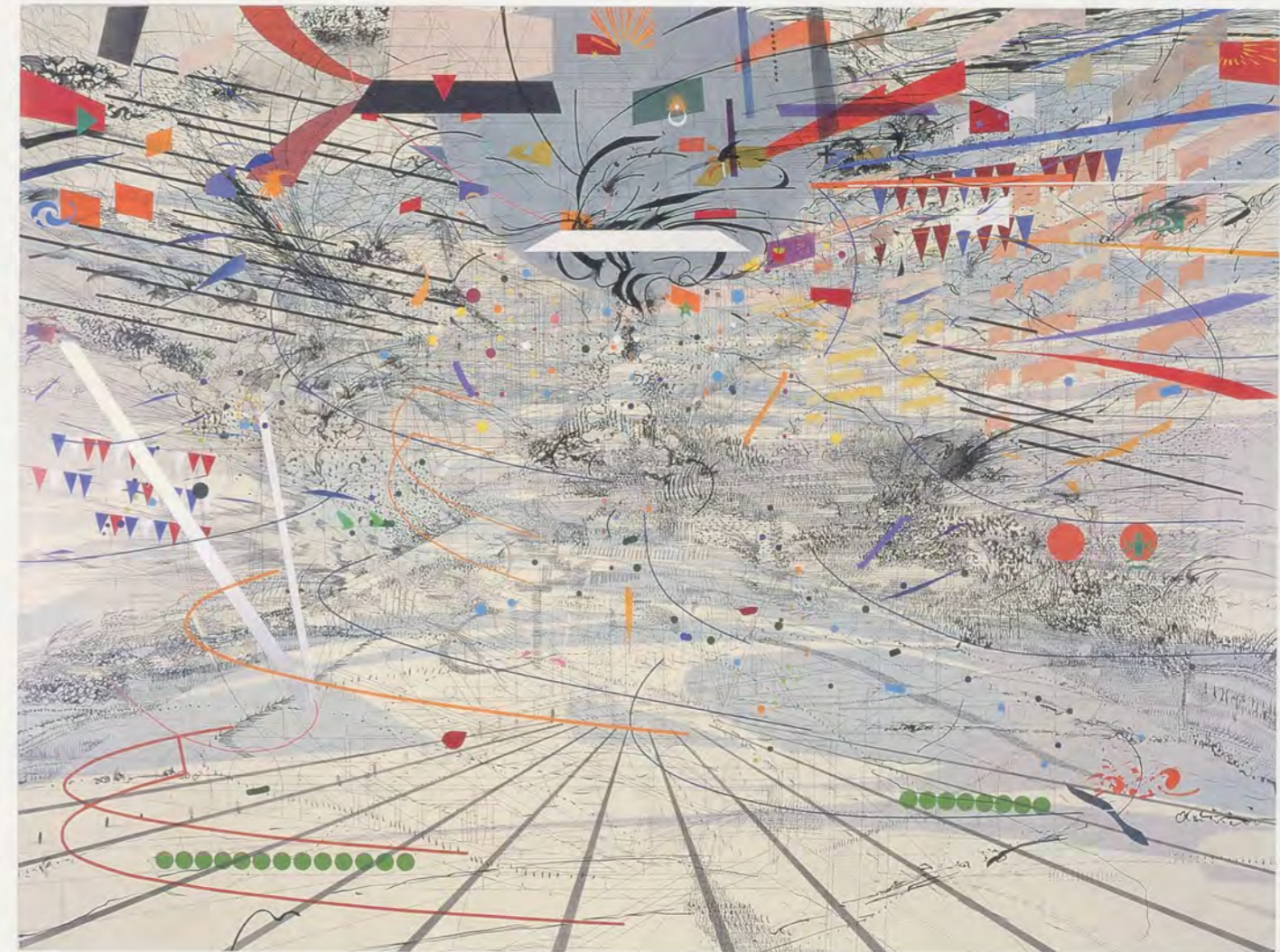
JULIE MEHRETU, CONGRESS, 2003, ink and acrylic on canvas, 70 x 102" / KONGRESS, Tusche und Acryl auf Leinwand, 178 cm x 260 cm.