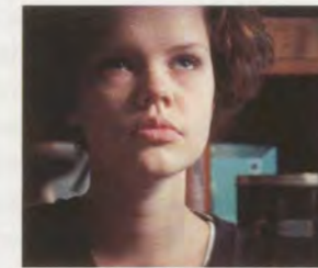
EIJA-LIISA AHTILA, IF 6 WAS 9 , 1995, 35-mm film, details.