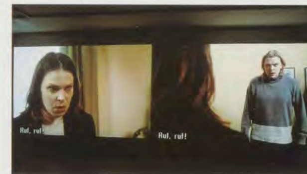
EIJA-LIISA AHTILA, CONSOLATION SERVICE , 1999, still from 24 min. 35-mm film / Bild aus dem 24-minütigen 35-mm-Film.

CI: In your installations, you shift between foregrounding image and narrative. Do the multiple screens help abstract or forefront the image, both compositionally, within the frame, and in the physical construction of the pieces? What is the difference between watching your films linearly in a cinema, and