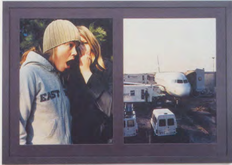
EIJA-LIISA AHTILA, SCENOGRAPHER'S MIND V, 2002, 2 color prints, set with hand- colored mat and frame, 42 1/8 x 66 15/16" / 2 Farbprints, Set mit handkoloriertem Passepartout und Rahmen, 107 x 170 cm.

in GRAY (1993), wo eine Person mit verschiedenen Stimmen die Wirkungen eines nuklearen Unfalls auf die Umwelt beschreibt.