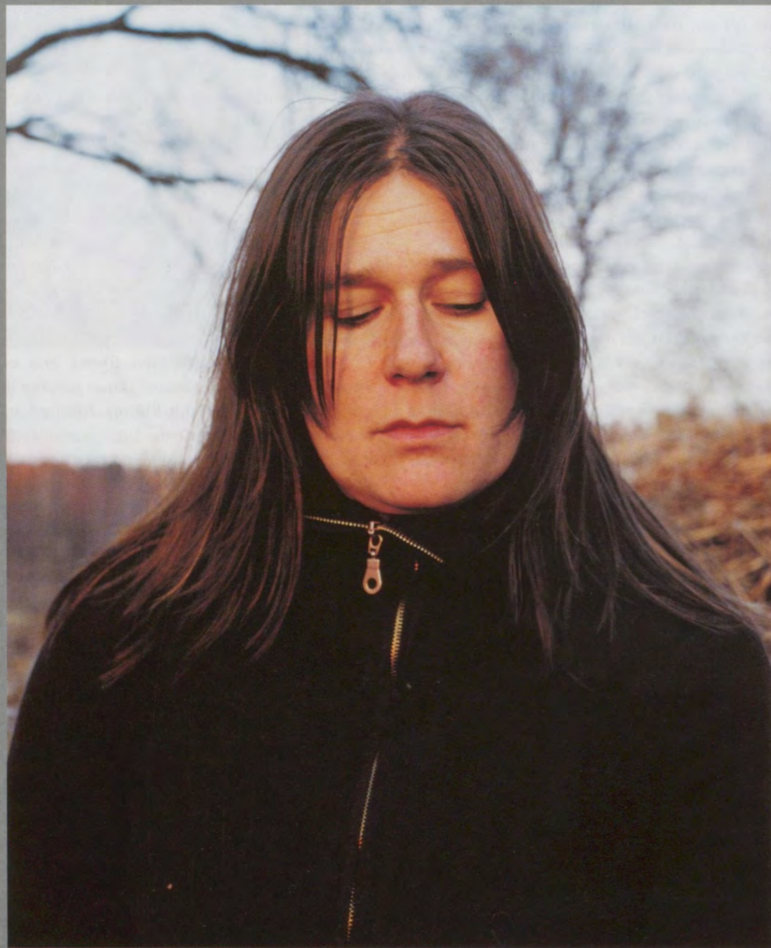
EIJA-LIISA AHTILA, SCENOGRAPHER'S MIND III, 2002, 2 color prints, set with hand-colored mat and frame 42 \frac{1}{8} x 66 \frac{15}{16} " / 2 Farbprints, Set mit handkoloriertem Passepartout und Rahmen, 107 x 170 cm.