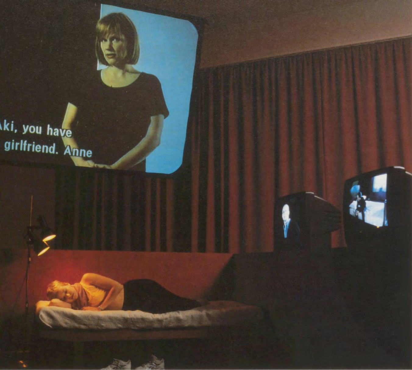
EIJA-LIISA AHTILA, ANNE, AKI AND GOD, 1998, 30 min. DVD installation for 2 projections and 5 monitors with sound; wooden structure, furniture, text / DVD-Installation für 2 Projektionen und 5 Monitore mit Ton, Dauer: 30 Min.; Holzgerüst, Möbel, Text.

tion felt more realistic, you couldn't choose sides: the woman's point of view in the story didn't appear to be emphasized. In the film, it became more obvious that the main character's presence directed the story.