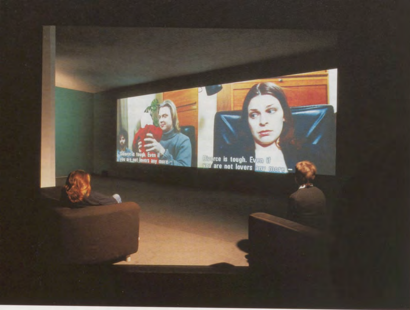
EIJA-LIISA AHTILA, CONSOLATION SERVICE , 1999, 24 min. 35-mm film, installation view / 24-minütiger 35-mm-Film, Installationsansicht.

meaning to things around you—creating a coherent world that makes sense. This is similar to what a scenographer does in her/his work; finding different places and constructing them in such a way that a believable world comes together. This is how the series SCENOGRAPHER'S MIND (2002) was named. One of the photographs includes kind of a doll's house for adults. This is something I still would like to work on, not with photographs, but in a more sculptural context.