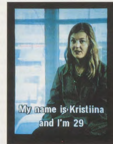
EIJA-LIISA AHTILA, ANNE, AKI AND GOD, 1998, stills from the 30 min. DVD / Stills aus der 30-minütigen DVD.