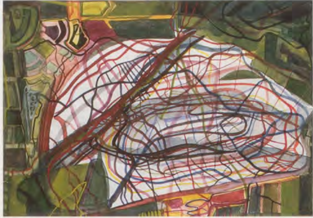
FRANZ ACKERMANN, OHNE TITEL (MENTAL MAP: SOON FINISHED), 1997, Mischtechnik auf Papier, 13 x 19 cm / mixed media on paper, 5 1/8 x 7 1/2".