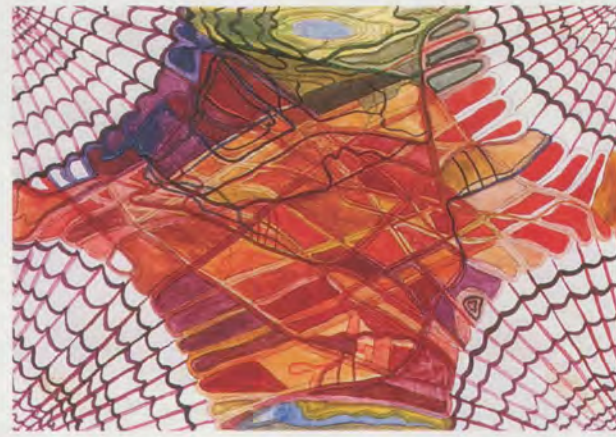
FRANZ ACKERMANN, OHNE TITEL (MENTAL MAP: CROSSING COUNTRIES), 1993, Mischtechnik auf Papier, 13 x 19 cm / mixed media on paper, 5 1/8 x 7 1/2".