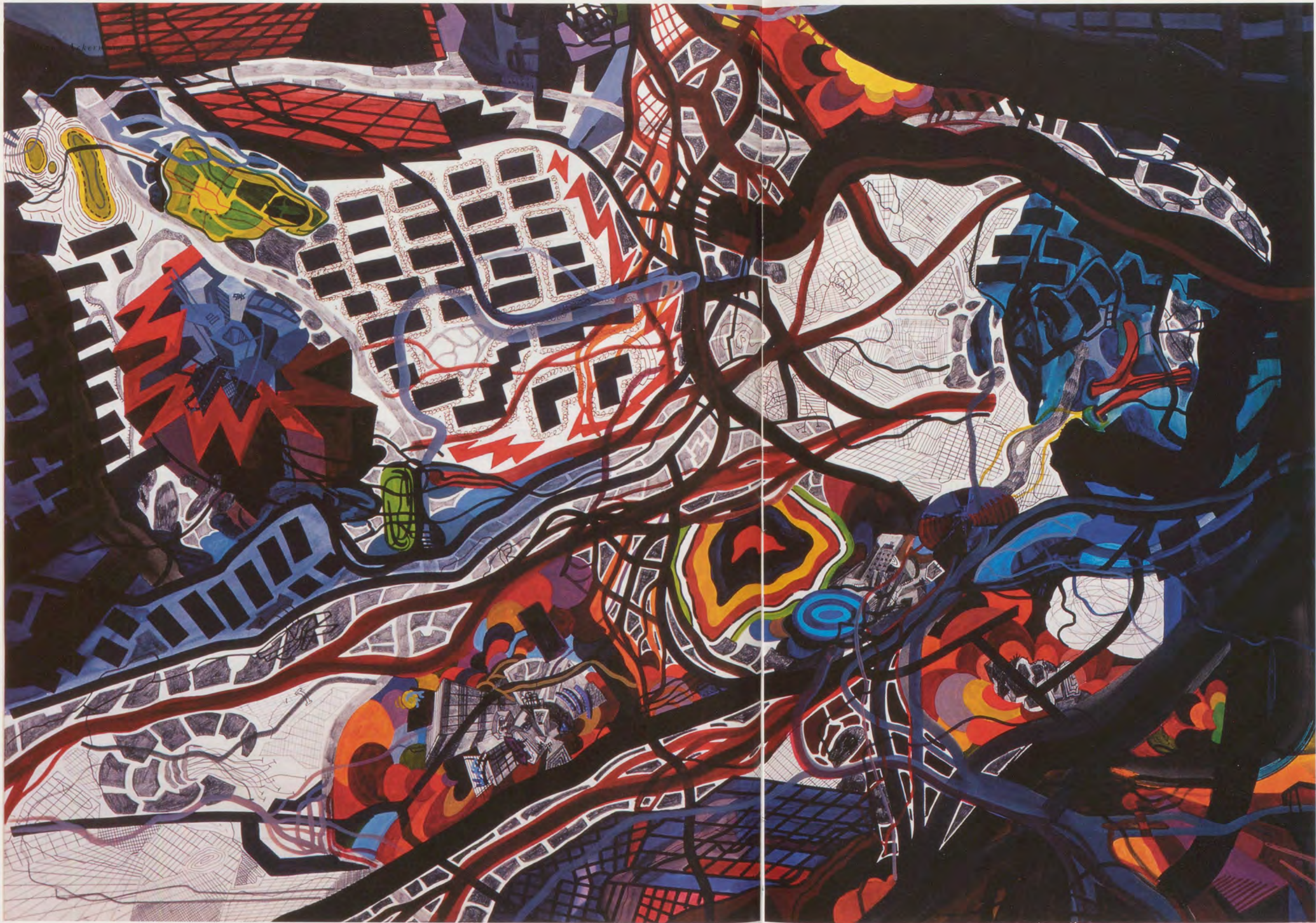
FRANZ ACKERMANN, GSP (GREATER SÃO PAULO), 2001, Mischtechnik auf Papier, 70 x 100 cm / mixed media on paper, 27 7 / 16 x 39 3 / 8 "