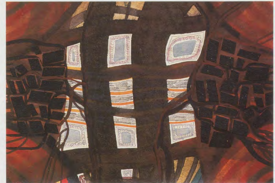
FRANZ ACKERMANN, OHNE TITEL (MENTAL MAP: JUST ANOTHER PLACE FOR RIOTS III), 1995, Mischtechnik auf Papier, 13 x 19 cm / mixed media on paper, 5 1/8 x 7 1/2".