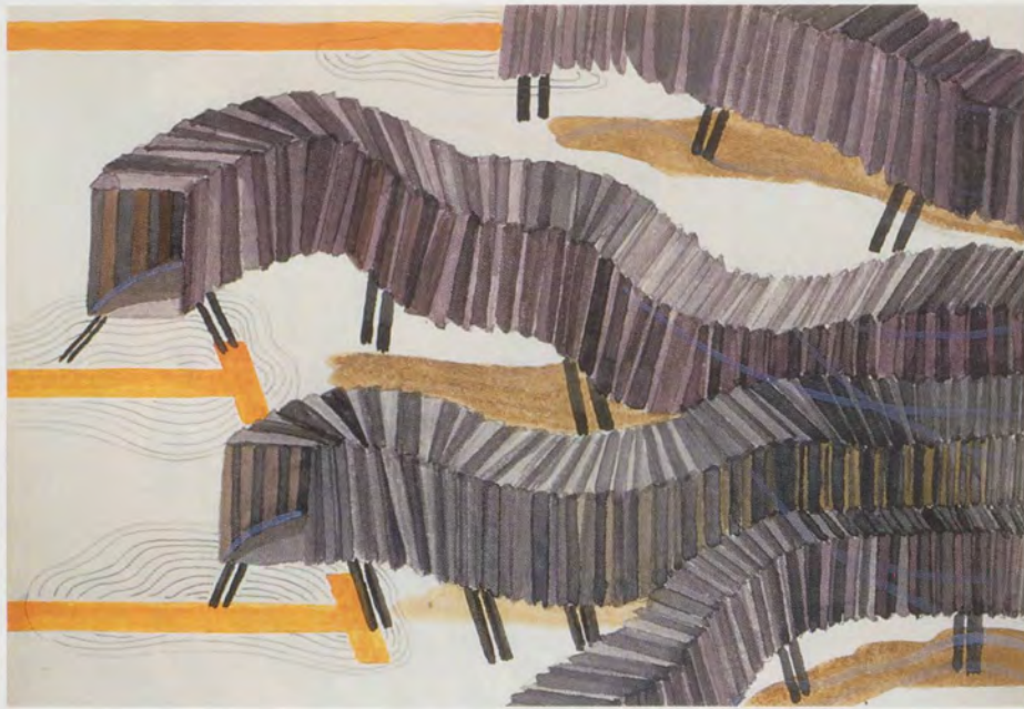
FRANZ ACKERMANN, OHNE TITEL (MENTAL MAP: SEAT 52A), 1998, Mischtechnik auf Papier, 13 x 19 cm / mixed media on paper, 5 1/8 x 7 1/2".