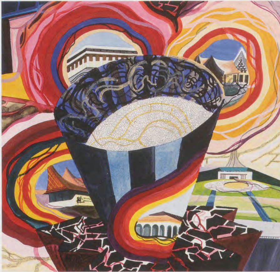
FRANZ ACKERMANN, UNTITLED (PACIFIC: MONUMENT OF CORRUPTION), 1999. Mischtechnik auf Papier, 29 x 34,5 cm / mixed media on paper, 11 7 / 16 x 13 9 / 16 ".

die Stadt als Schauplatz der Begegnung zwischen Differenzen, als Raum, der sowohl soziale Beziehungen schafft, als auch selbst durch soziale Beziehungen entsteht. Lefebvre meint, dass unsere Auffassung des zeitgenössischen urbanen Lebensraums widersprüchlich sei: Einerseits verstehen wir ihn als abstrakten Raum, der hierarchischen Ordnungsbegriffen unterliegt (Zentrum, Peripherie u.a.), welche die herrschenden Wirtschaftsverhältnisse zementieren, andererseits aber auch als Raum der Brüche, der Trennungen, des Flusses und der Zertrümmerung.