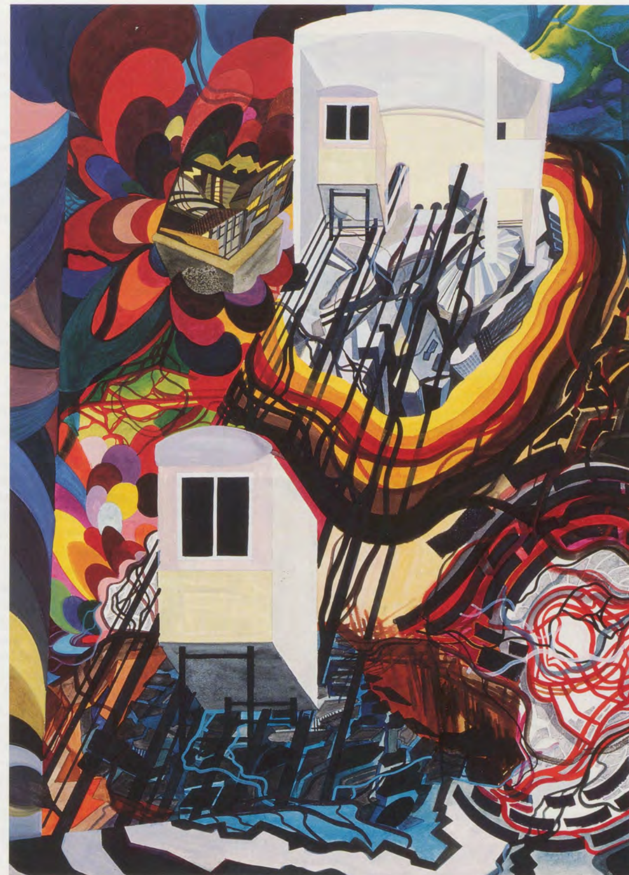
FRANZ ACKERMANN, OHNE TITEL (MENTAL MAP: CROSSING CITIES), 1999, Mischtechnik auf Papier, 70 x 50 cm / mixed media on paper, 27 9/16 x 19 11/16"

...a continuous re-generation of cartographic lo-