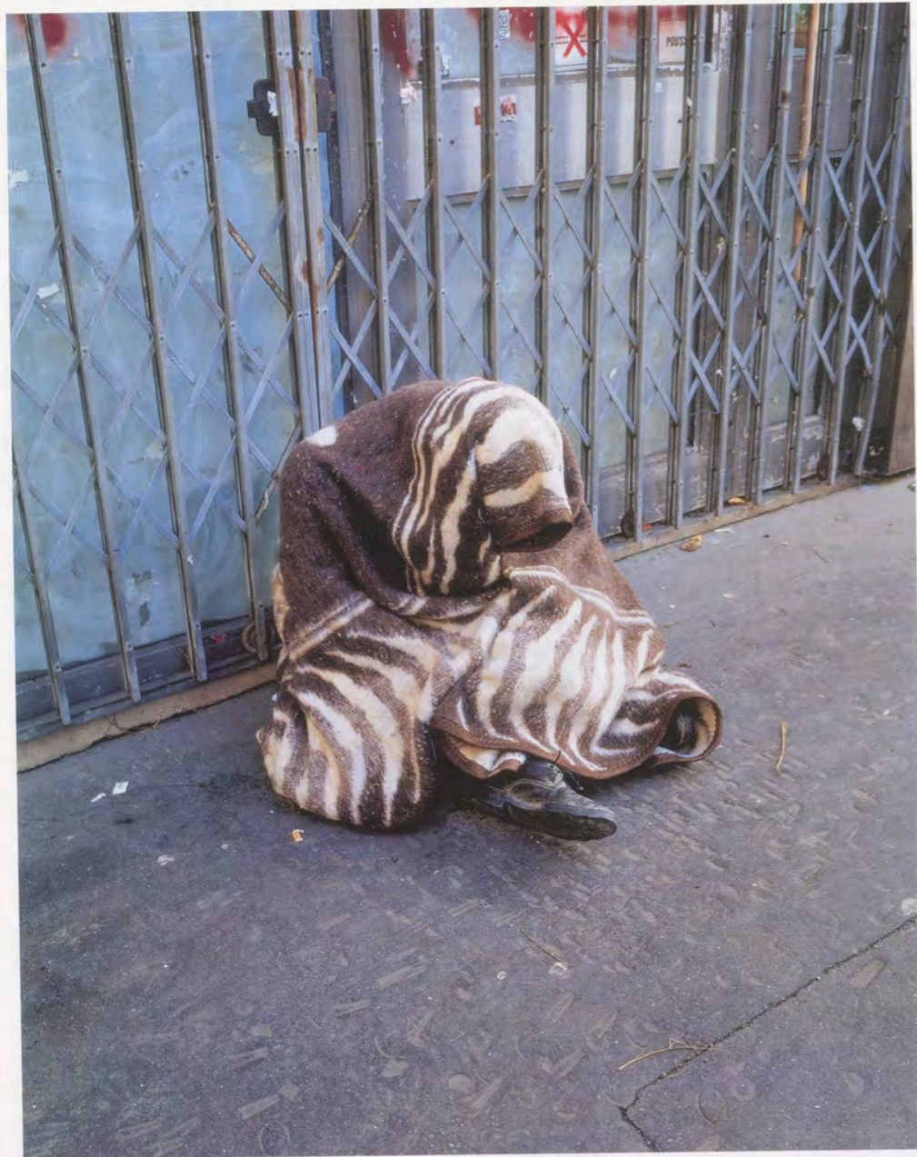
MAURIZIO CATTELAN, UNTITLED (GÉRARD), 1999, lifesize plastic dummy, clothes, shoes / OHNE TITEL (GÉRARD), Plastikpuppe, Kleider, Schuhe.