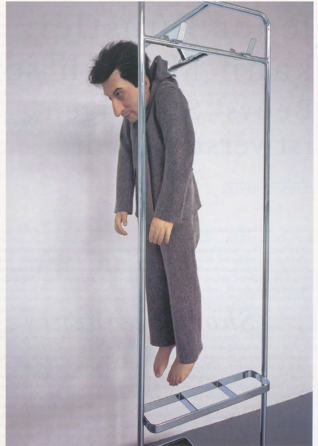
MAURIZIO CATTELAN, LA RIVOLUZIONE SIAMO NOI / WE ARE THE REVOLUTION, 2000, Migros Museum für Gegenwartskunst, Zürich / DIE REVOLUTION SIND WIR.