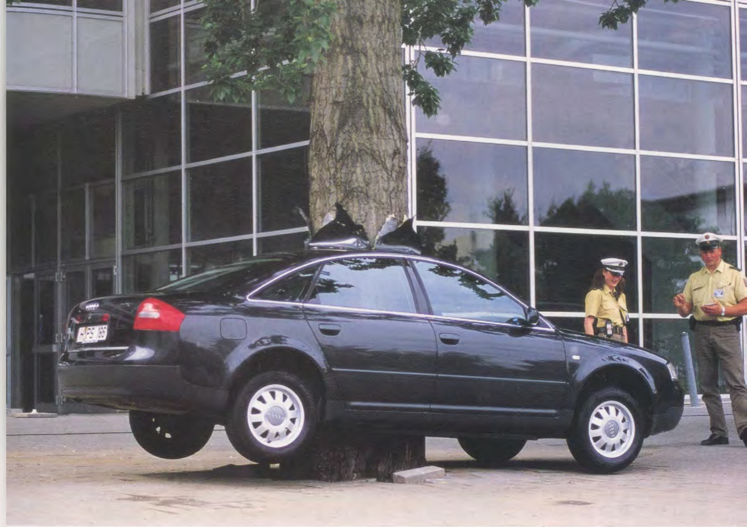
MAURIZIO CATTELAN, UNTITLED, 2000, car installation at the Expo Hannover / OHNE TITEL.

tion of European saints and pilgrims. For them, art is a coded language that allows for communication with different species: Their audience is more like St. Francis's birds than Studio 54's paparazzi. Yet never have two artists been more dissimilar from each other—one a shaman and the other a street actor and, like these characters, both sharing a fantastic amount of hypocrisy. They fight, at different levels, the formal narrative of contemporary art, and yet over and over again they are able to create sculptural visions. Their ability is in transforming revolutionary and iconoclastic energy into pure art works, while