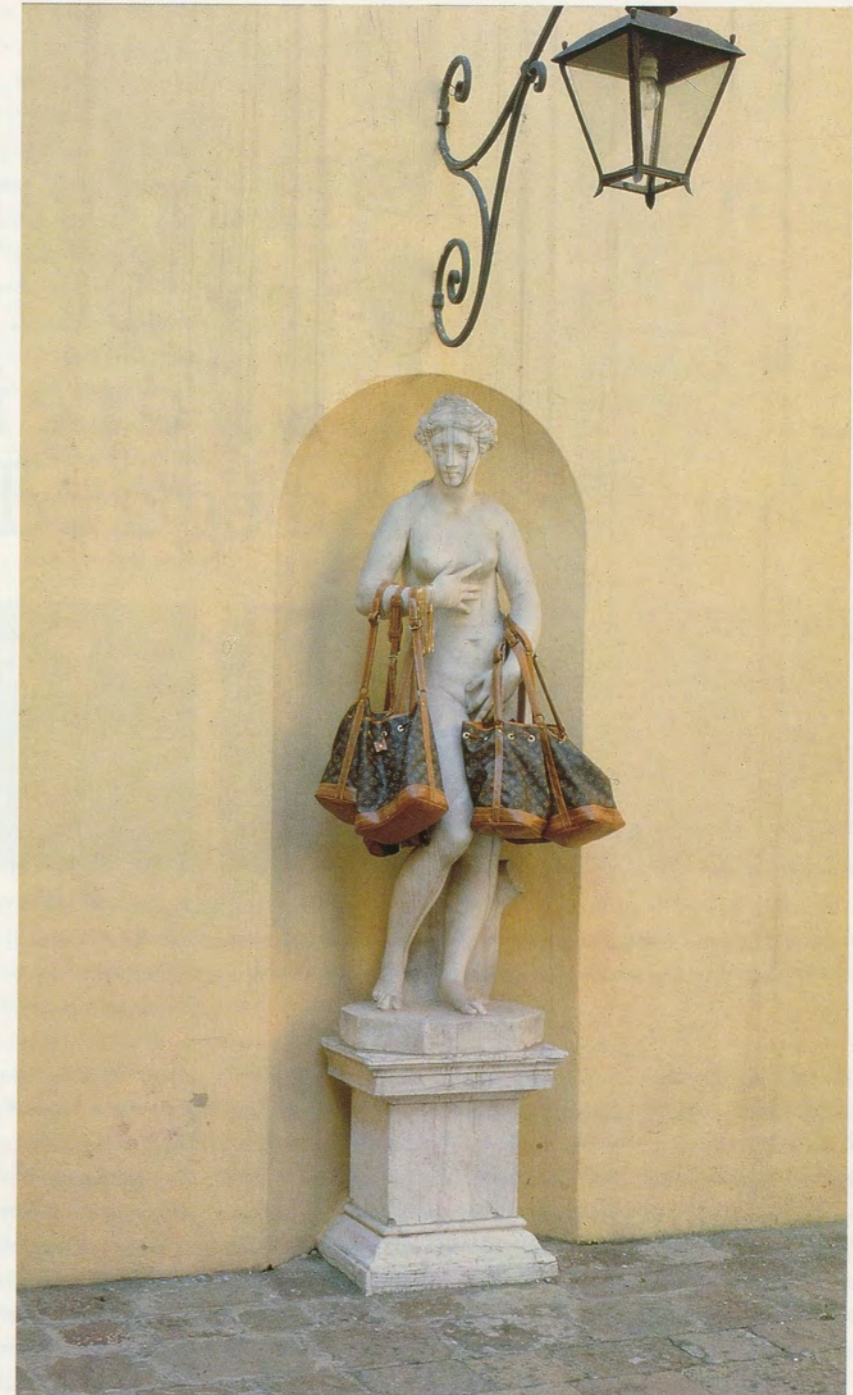
DAVID HAMMONS, BAG LADY, Venice, 1990.