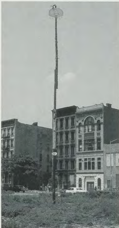
DAVID HAMMONS, HIGHER GOALS, Harlem, 1982 /HÖHERE ZIELE, Harlem, 1982.

In the process he turns haiku into kabuki . By haiku I mean that he meditates on uncut funk and brings it into high art, as a poet on Shikoku might seize the stone-ness of a mountain stone and compress that vision within an elegantly inherited economy of voice. This is what he does with skillets and bones and fat-fried chicken wings. As to kabuki I mean his gift for translating what he observes, believes in, and loves into performance. His melting ice show was, in part, meant to drive midtown munchkins crazy, making them mop up things for a change. Draping Senegalese-sold handbags over a classicizing sculptured nude in Italy and calling the work BAG LADY compacted various sardonic haiku into one, creating an indelible stage impression. Switching contexts from Venice to the Lower East Side, his puppeteering is discourse meant for peers; he makes these puppets for the loving entertainment of fellow artists in an Alphabet City bar.