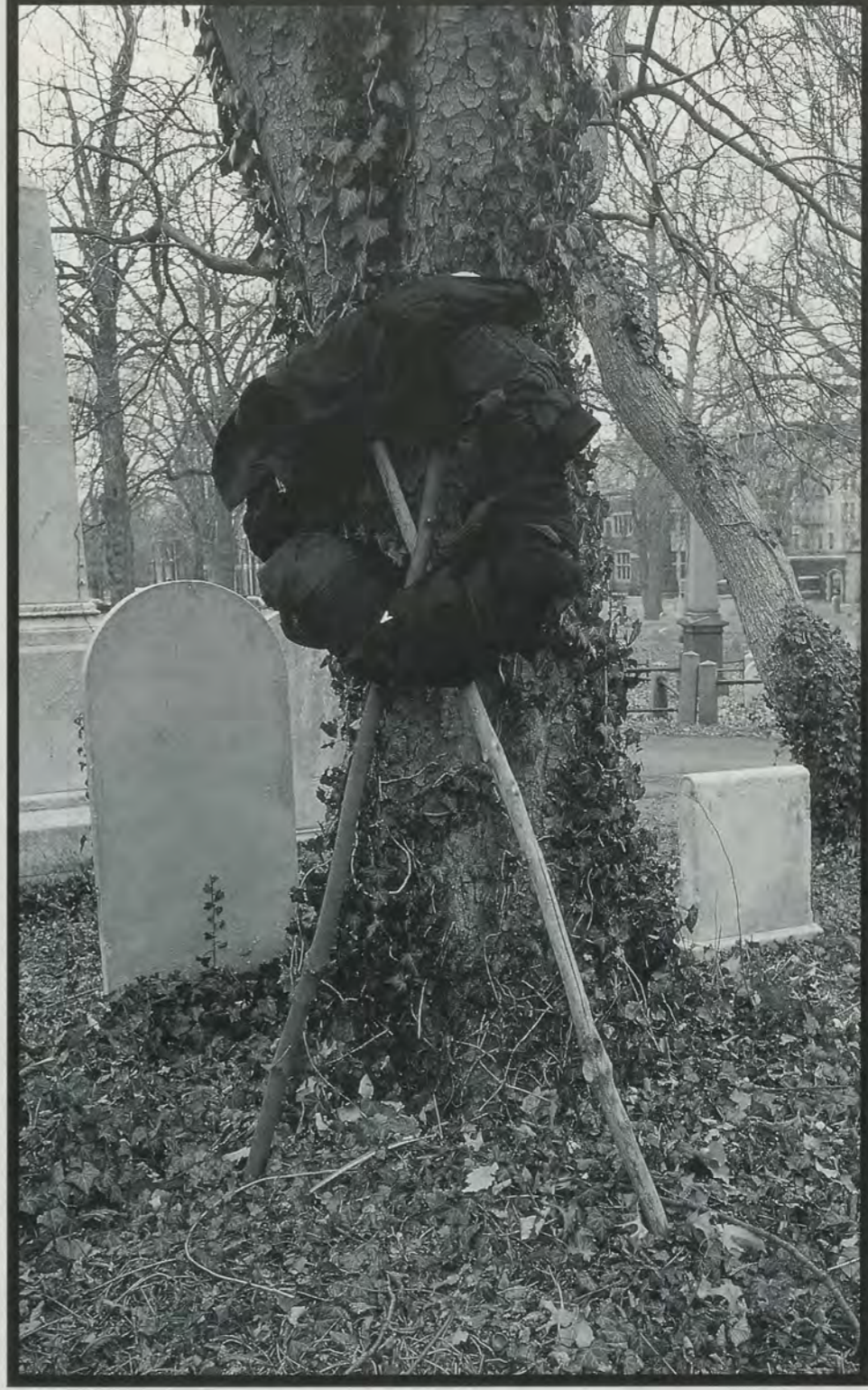
DAVID HAMMONS, DEATH FASHION, 1992/TODESMODE, 1992.