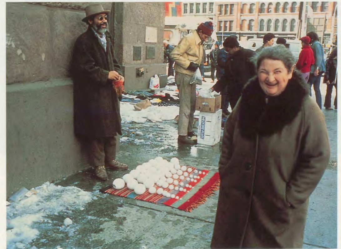
DAVID HAMMONS, BLIZ-AARD BALL SALE, New York, 1983 /BLIZ-AARD SCHNEEBALL-VERKAUF, New York, 1983.

If philosophy is being at home with self and past, Hammons is assured of his superiority. Testing life and testing art in equal measure, he brings forth Harlem's history with a brilliance underscoring what Kenneth Burke suggested years ago, "The important thing is not to confine the explanation to one principle but to formulate sufficient principles to make an explanation possible."