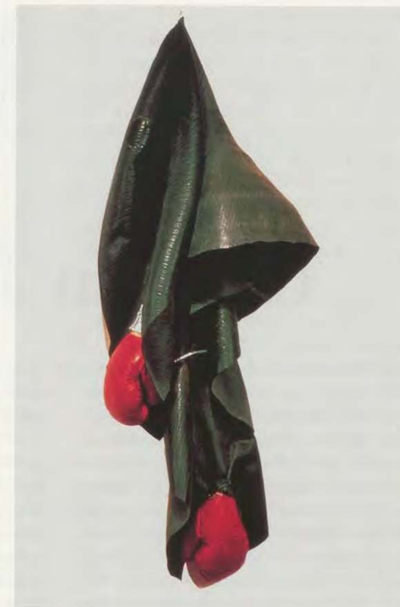
DAVID HAMMONS, CHAMP, 1988, inner tubes, boxing gloves/

Fahrzeugschlauch, Boxhandschuhe.