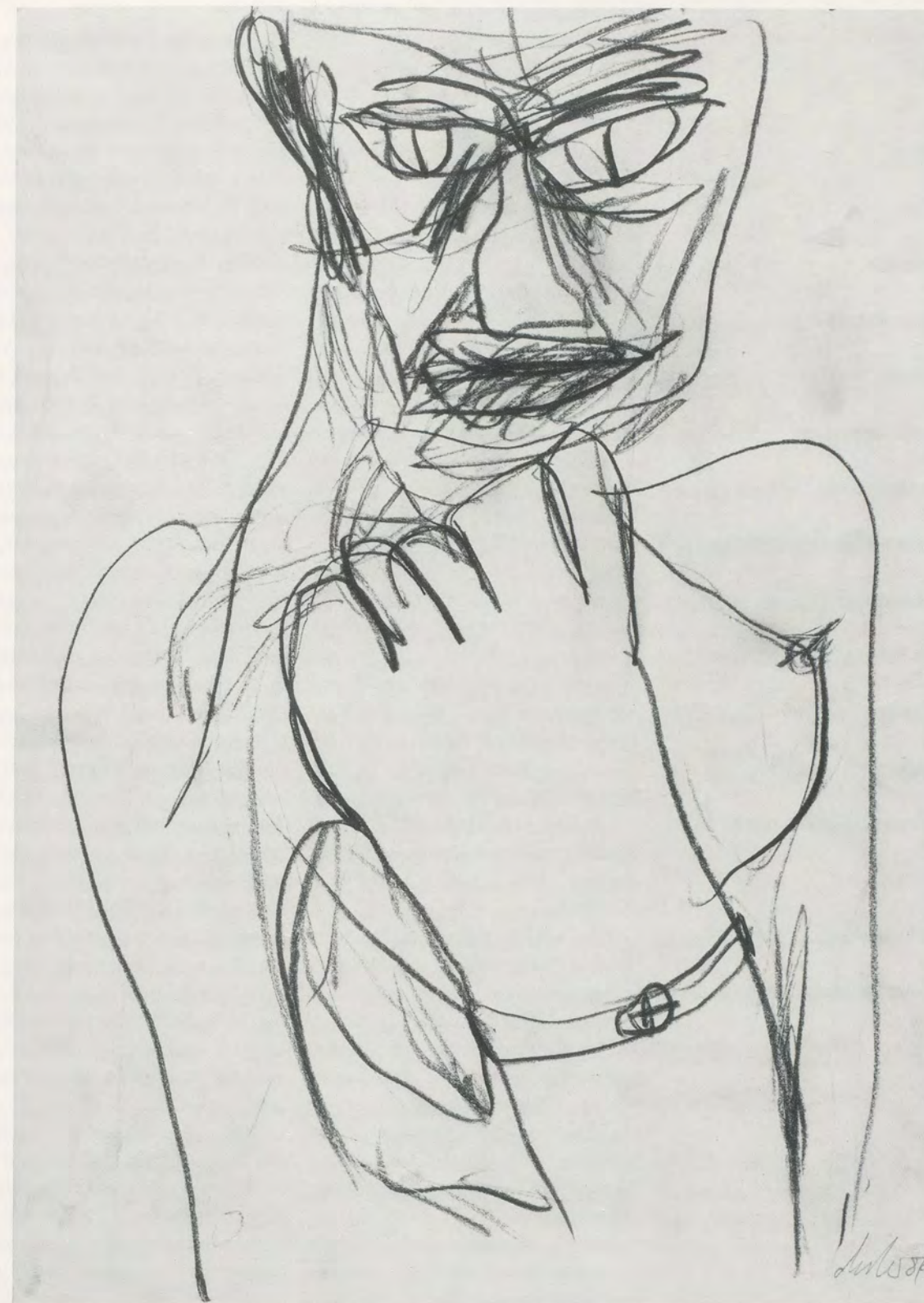
Martin Disler, ohne Titel / untitled, 1984, Bleistift / pencil, 42 x 30 cm / 16 1/2 x 11 3/4 "

Abgeschlossen und abgerundet wird das Buch mit zwei eindrücklichen Parabeln, die Dislers Idee vom Künstler darstellen sowie sein wachsendes Bewusstsein einer fordernden Öffentlichkeit und die Gefährdungen, die das Exzessive seines Schaffens mit sich bringt. In der einen ist der Künstler ein «Baukastensystem aus Bevölkerungsteilen», dem die Farbe