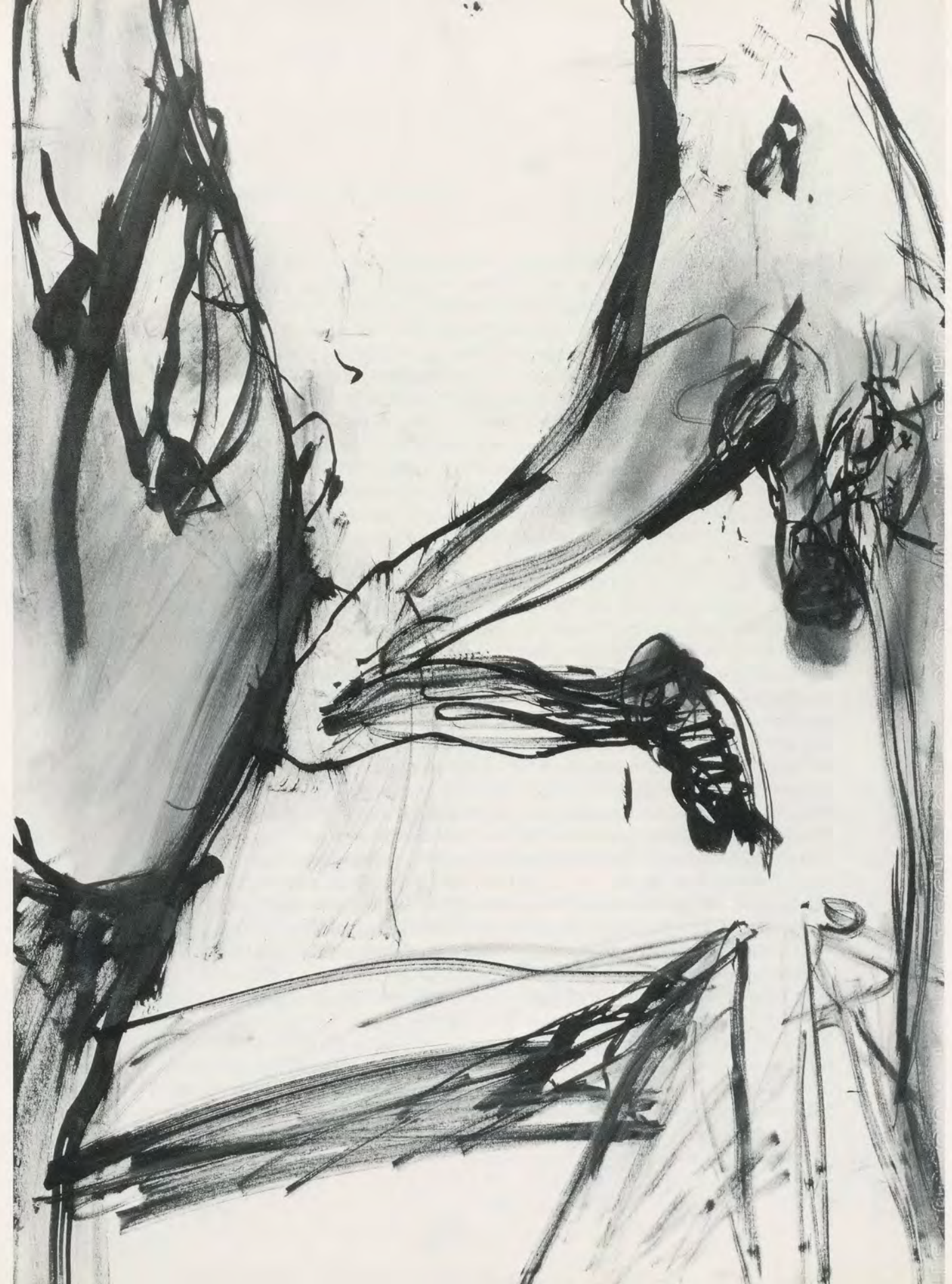
Martin Disler, ohne Titel / untitled , 1984, Tusche / ink, 42 x 29,7 cm / 16½ x 11¾"