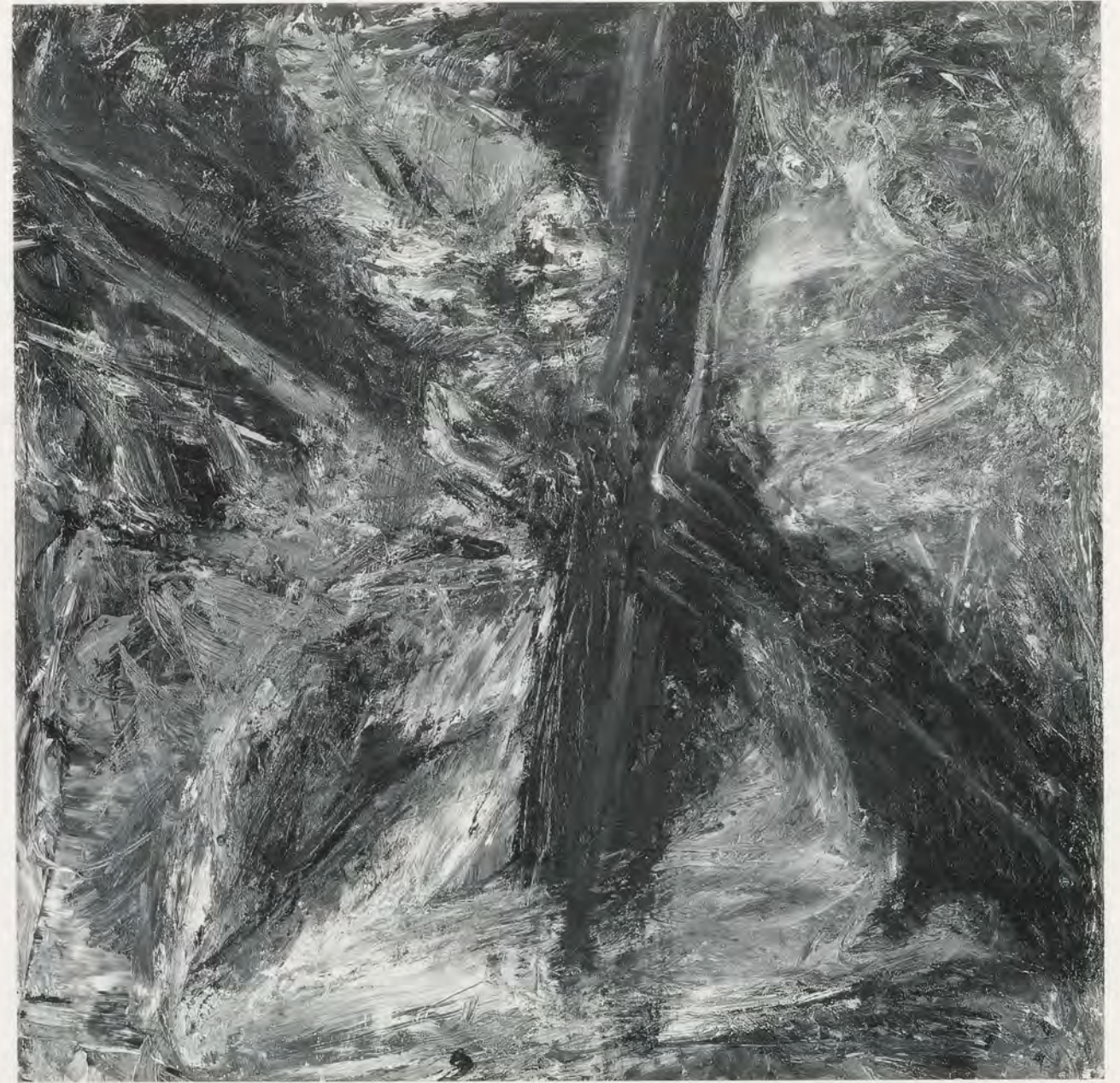
Martin Disler, IM DREHKREUZ / IN A TURNSTILE , 1984 Öl auf Leinwand / Oil on canvas , 100 x 100 cm / 39 1/3 x 39 1/3".

Vorderseite / preceding page : Martin Disler, 1984.