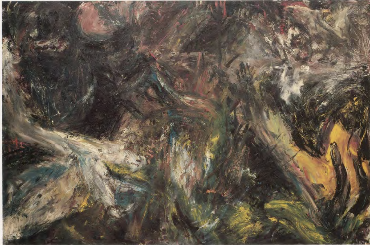
Martin Disler, HOLDING A STAR AND FUCKING THE SKY , 1984, Öl auf Leinwand / oil on canvas, 130 x 195 cm / 4 x 6'