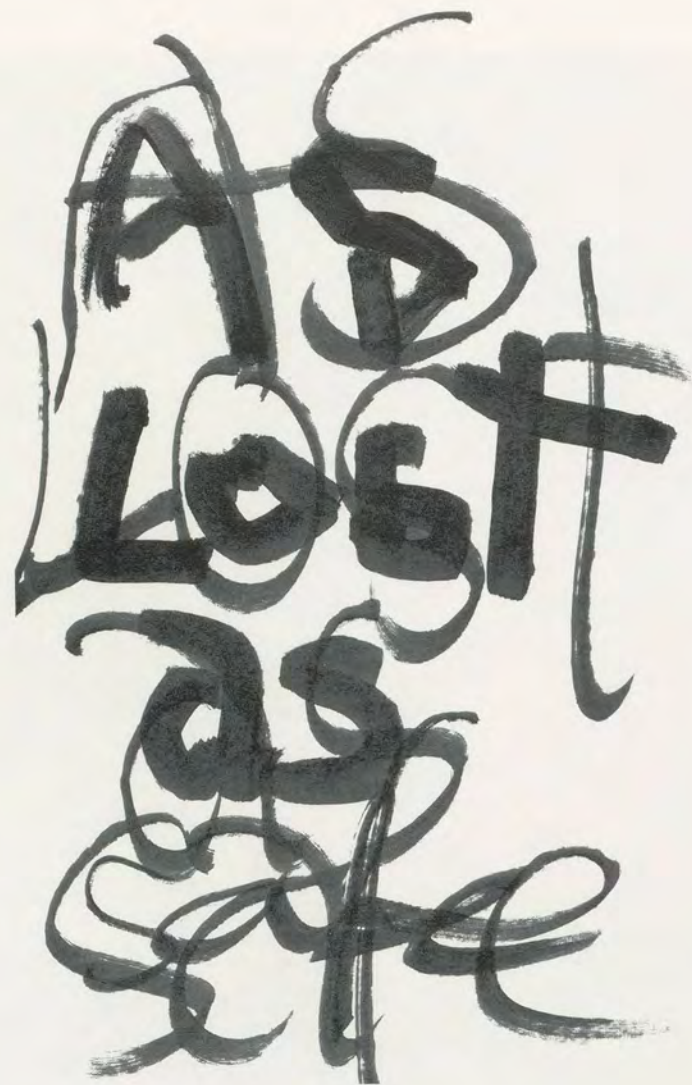
Martin Disler, AS LOST AS SAFE , 1983, Filzstift / felt pen, 29,7 x 21 cm / 11 3/4 x 8 1/4"

ten Bildes von Disler, das beweglich geworden und in den Raum getreten ist. Raum- und Zeitdimensionen sind höchst unsicher, Halt wird immer nur vorübergehend geboten; Wirklichkeitsebenen geraten durcheinander — aber: «Was da alles aufschimmert in den Wogen!» Wiederholtes Lesen führt zu Überraschungen und Entdeckungen, überall lauert