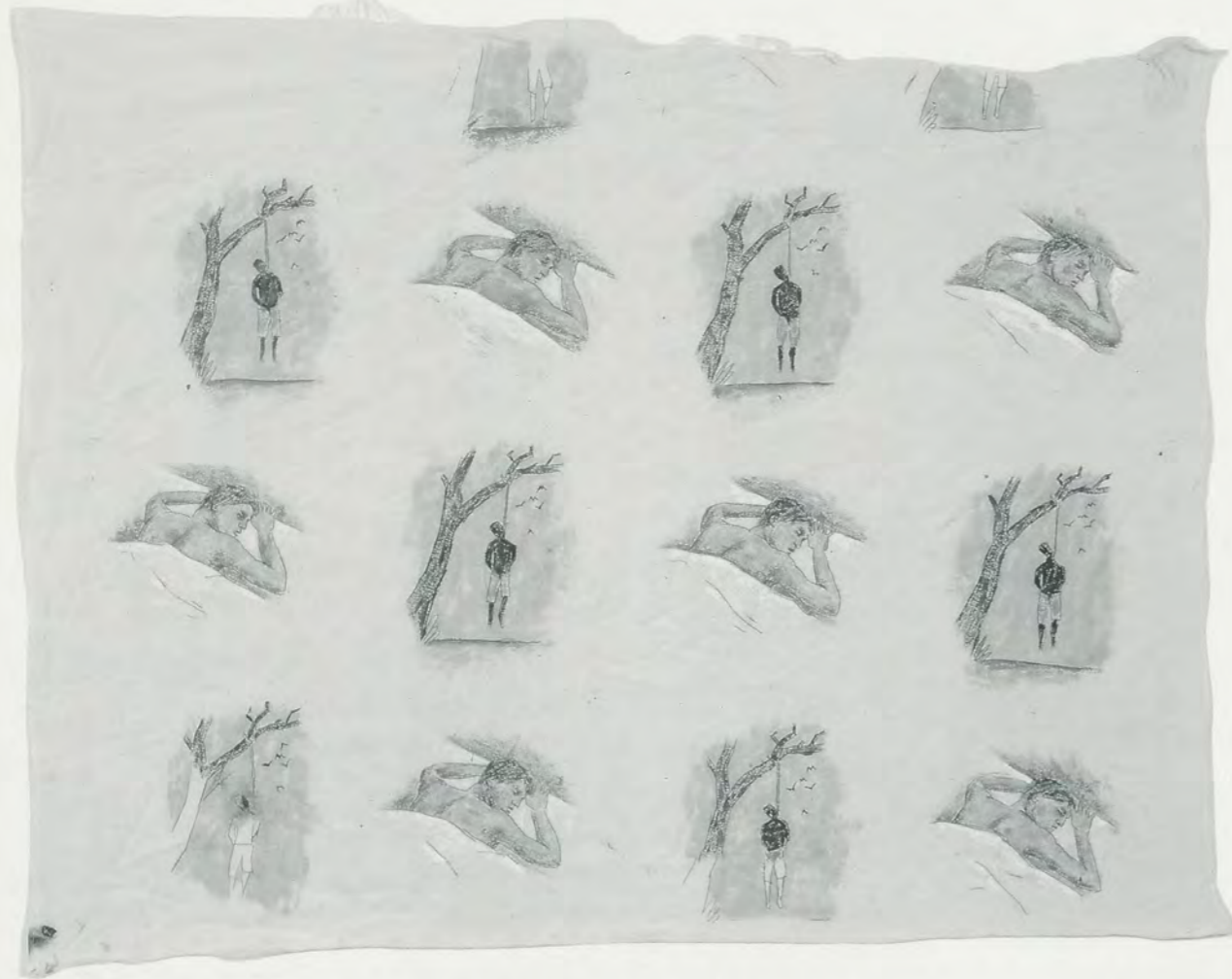
ROBERT GOBER, HANGING MAN/SLEEPING MAN, 1989, (detail of wallpaper) silkscreen on paper/GEHÄNGTER MANN/SCHLAFENDER MANN, 1989, (Detail einer Tapete), Siebdruck auf Papier. (Original drawing/Original Zeichnung).

there was a piece missing in that puzzle about the crime, about what happened and what the story was, and it was left up to the viewer. It was a Rorschach kind of image. Also, the sleeping man could have been dreaming, so there was the possibility that this was a racist fantasy or dream, which I felt gave the work its edge – but I think it brought up big problems too. I think the fact that the image was repeated to create a “pretty pattern” of wallpaper made it doubly offensive. The brutality becomes decoration. It lines your walls and goes on indefinitely. Perhaps if I