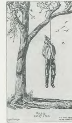
CARTOON, TEXAS, LATE TWENTIES/KARIKATUR, TEXAS, SPÄTE 20ER JAHRE.

N.R. Wir sprechen also über eine Konvergenz von Ereignissen. Die Veränderung des Standorts und des Kontexts eines Werks ist dabei wichtig, weil das Publikum ändert. In gewissem Sinne tragen wir – die Mitarbeiter des Museums – teilweise die Verantwortung dafür, wie man damit umgeht.