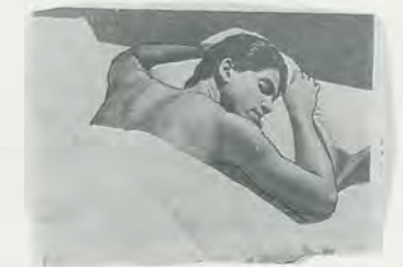
bloomingdales 1 DAY & 1 WEEK! REDUCE A FID. For Customer Service Or Online Approval. BED & BATH COMFORTS

Die Frage, ob ein Werk verletzend ist, ist das eine, und die Frage, ob ein Werk wirkungsvoll ist, das andere.