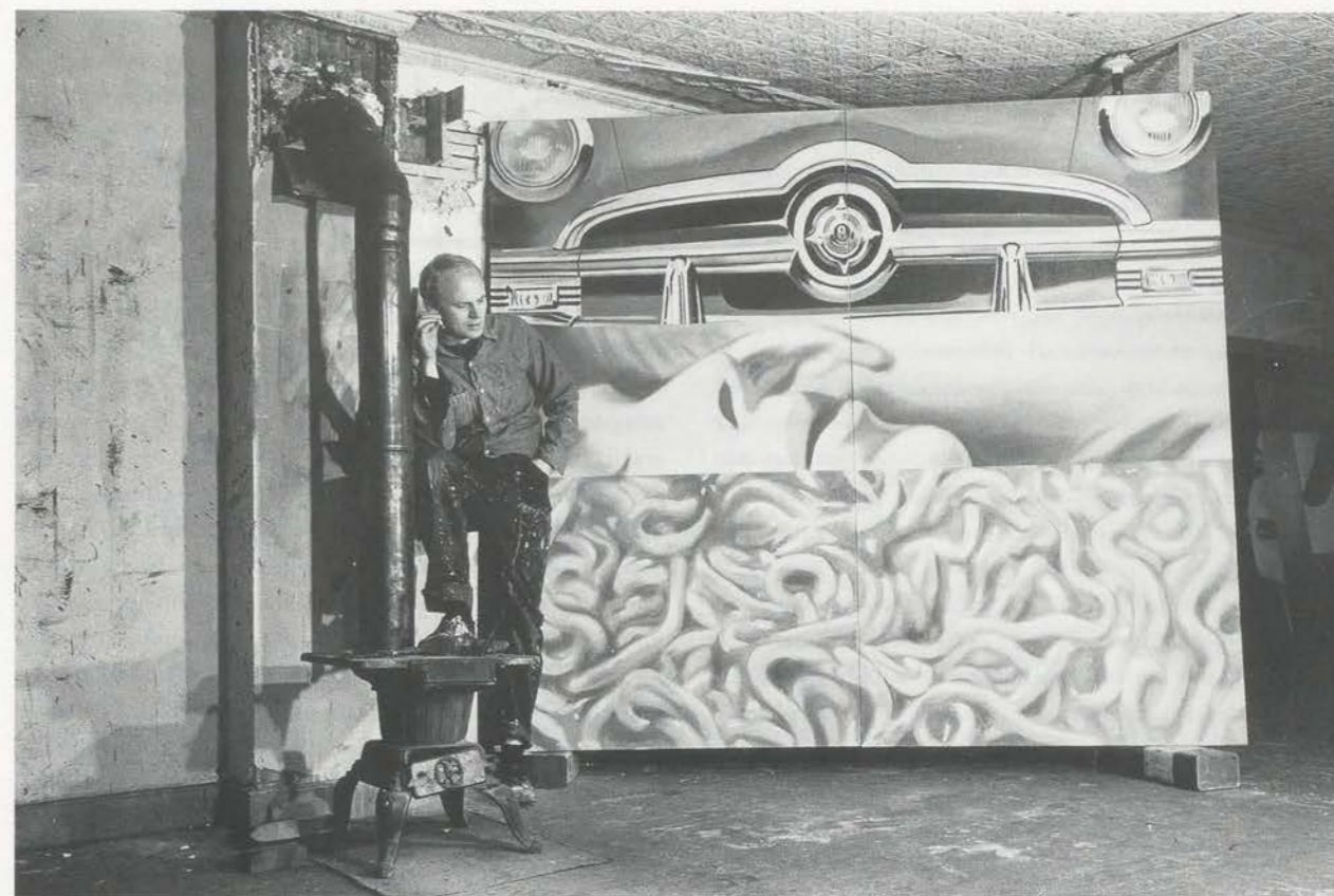
The artist in his studio with I LOVE YOU WITH MY FORD, 1961-62 / Der Künstler in seinem Atelier mit ICH LIEBE DICH MIT MEINEM FORD.

JR: I never met Marilyn, but I saw her twice in New York. Once she jumped out of a limousine to get the Sunday Times , and she accidentally knocked the pile of Times over and jumped back in the car. And then in Times Square with Arthur Miller. She was really beautiful. And then, bang, she died. I made a painting as advertisement. And in 1960, I also did John Kennedy (PRESIDENT ELECT), another self-advertisement. I also did another actress, Joan Crawford, because she sent candy grams to a whole bunch of artists saying that she was going to have a Pop