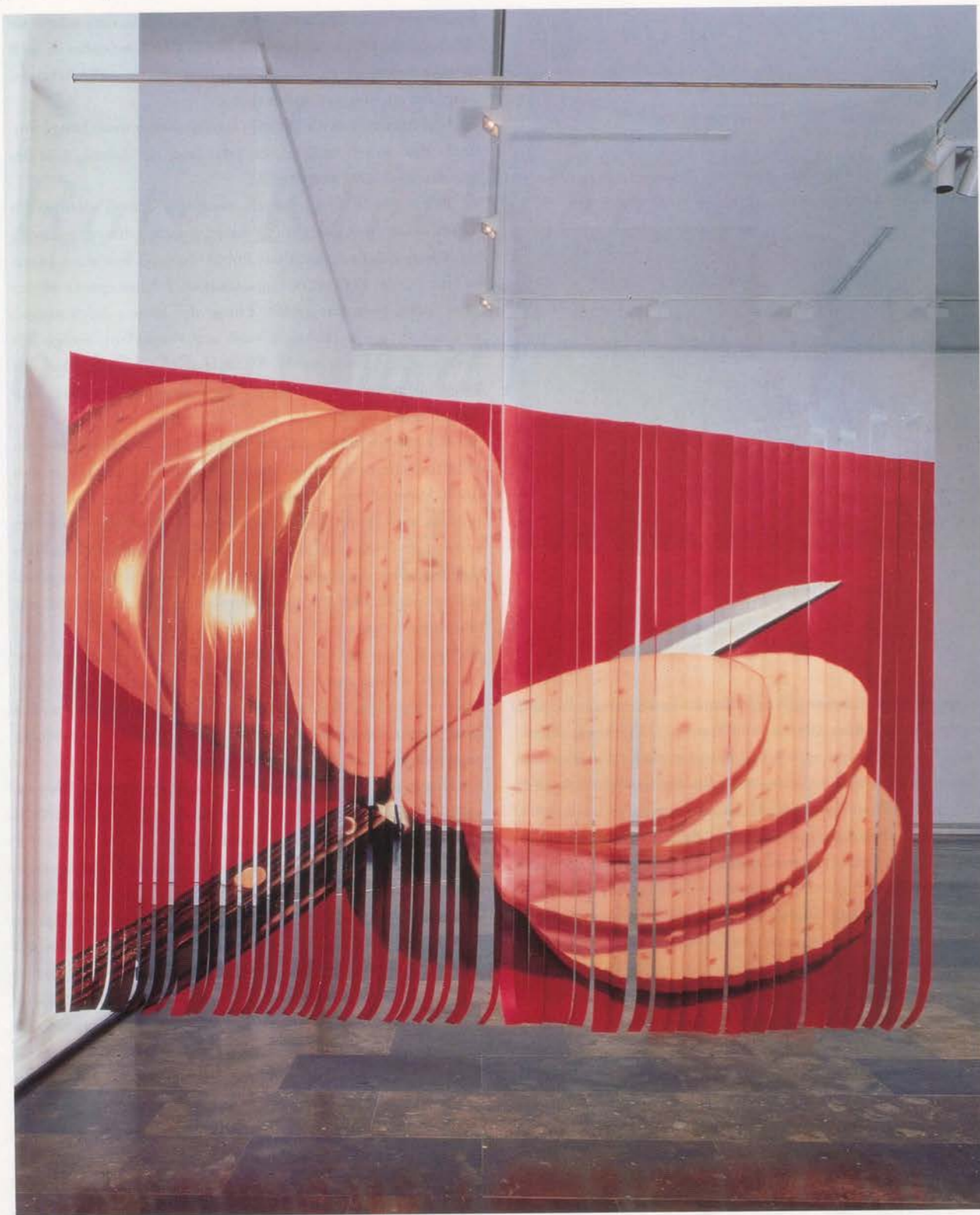
JAMES ROSENQUIST, SLICED BOLOGNA, 1968, oil on plastic, 102 3/8 x 105 1/2" / AUFSCHNITT, mit Öl bemalte und geschnittene Plastikfolie, 260 x 268 cm.

Ich war ein ganz normaler Junge, lebte in Minneapolis, hatte einen frisierten Wagen und ein Motorrad. Dann bekam ich ein Stipendium von der Art Student's League . Ich kam also nach New York mit dreihundert Dollar in der Tasche. Ich mietete ein Zimmer in der 57. Strasse, in der Nähe des Columbus Circle, für acht Dollar die Woche. Zwischen diesem Zimmer und der Art Student's League pendelte ich hin und her. Gelegentlich wurde ich von George Grosz zu einer Party eingeladen. Er schenkte mir eine Zigarre; er war sehr elegant, während ich nur in Jeans und Sweatshirt rumlief. Ich verlor das Interesse an dem ganzen materialistischen Kram und lernte die Vertreter der Beat-Generation kennen: Jack Kerouac, Richard Bellamy (der dann die Green Gallery eröffnet), Allen Ginsberg, solche Leute. Die waren etwas nostalgisch, genossen aber eine existenzielle Freiheit. Sie lasen weggeworfene Zigarettenstummel vom Boden auf und rauchten sie weiter. Ich verlor jeden Kontakt zu meiner kleinbürgerlichen Herkunft und mit meinem Leben ging es mal bergauf, mal bergab. Dann erhielt ich einen Job als Barkeeper und Chauffeur bei den Stearns. Ich lebte in einem herrschaftlichen Haus, mixte Drinks und fuhr die Leute zu Blumenausstellungen. Ich mochte sie sehr.