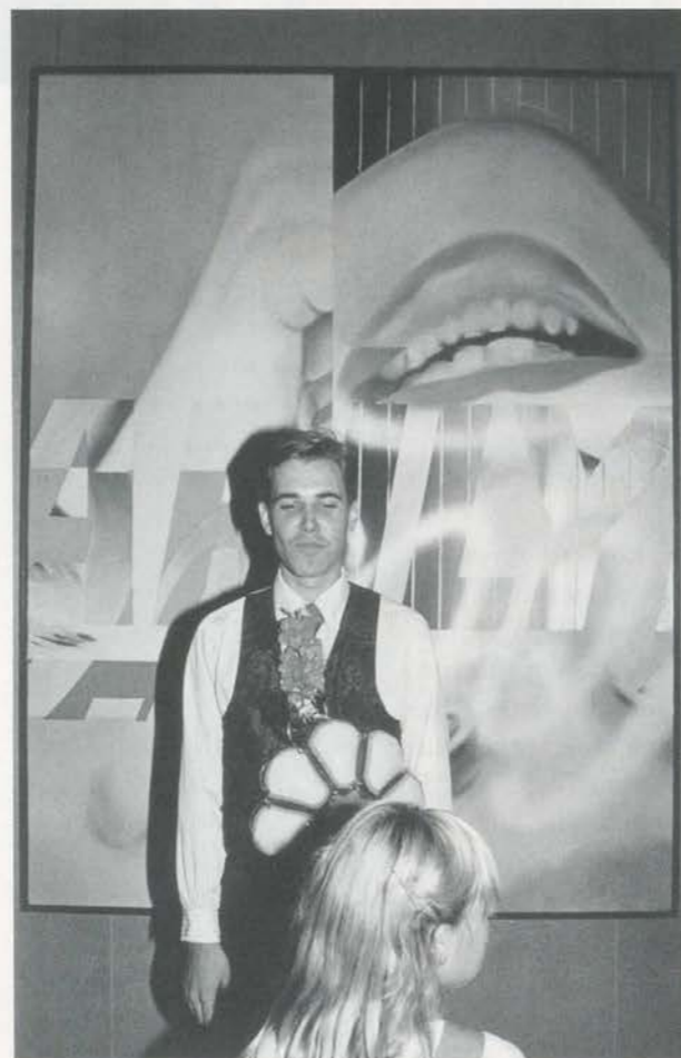
Jeff Koons in front of Jim Rosenquist's MARILYN MONROE I , 1962, at the Museum of Modern Art, New York, 1978.