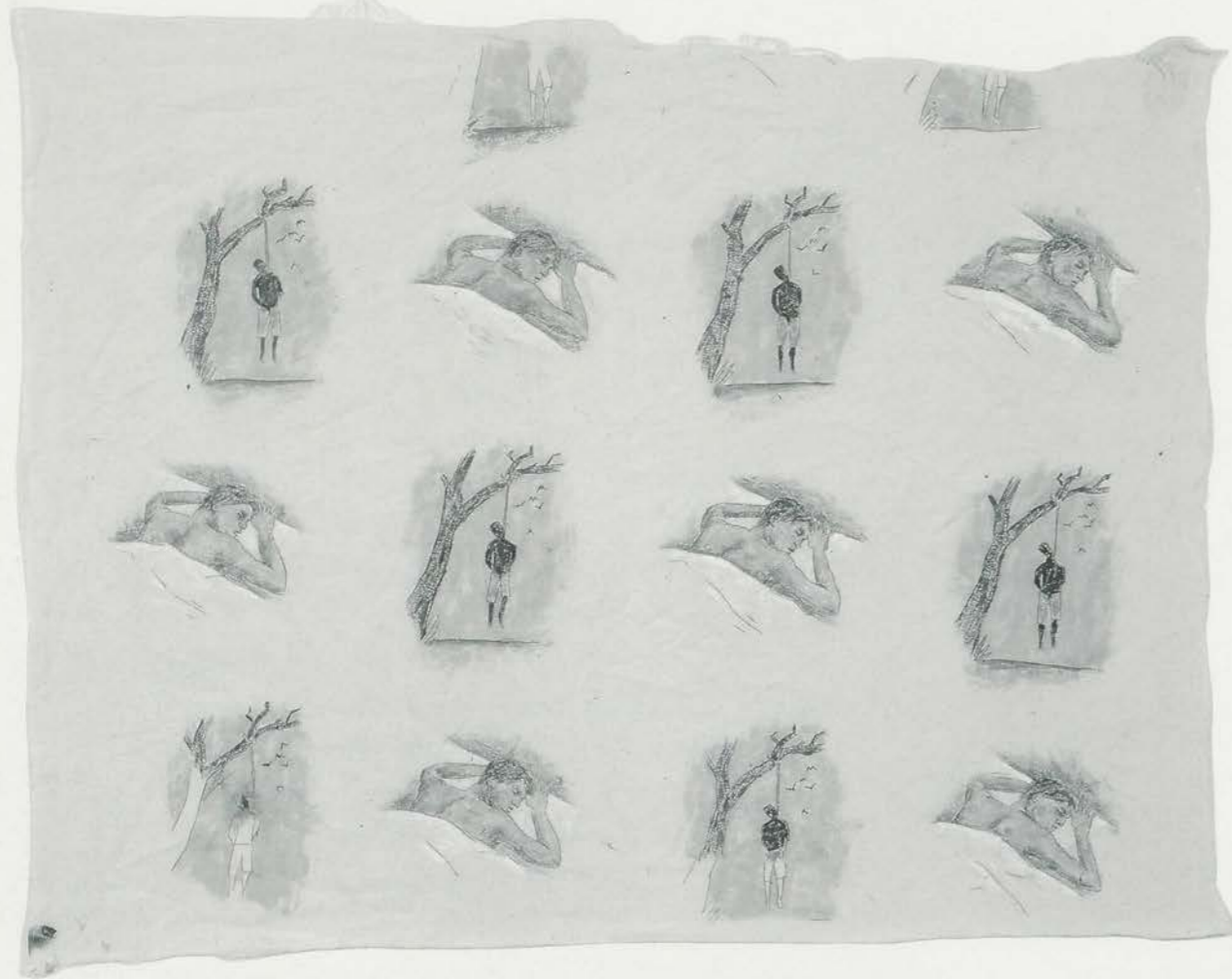
ROBERT GOBER, HANGING MAN/SLEEPING MAN, 1989, (detail of wallpaper) silkscreen on paper/GEHÄNGTER MANN/SCHLAFENDER MANN, 1989, (Detail einer Tapete), Siebdruck auf Papier. (Original drawing/Original Zeichnung).

there was a piece missing in that puzzle about the crime, about what happened and what the story was, and it was left up to the viewer. It was a Rorschach kind of image. Also, the sleeping man could have been dreaming, so there was the possibility that this was a racist fantasy or dream, which I felt gave the work its edge – but I think it brought up big problems too. I think the fact that the image was repeated to create a “pretty pattern” of wallpaper made it doubly offensive. The brutality becomes decoration. It lines your walls and goes on indefinitely. Perhaps if I