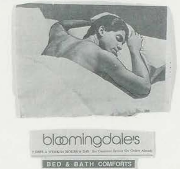
AD FOR BLOOMINGDALE'S/ INSERAT FÜR BLOOMINGDALE'S.

Die Frage, ob ein Werk verletzend ist, ist das eine, und die Frage, ob ein Werk wirkungsvoll ist, das andere.