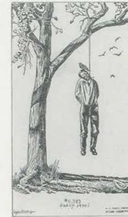
CARTOON, TEXAS, LATE TWENTIES/KARIKATUR, TEXAS, SPÄTE 20ER JAHRE.

N.R. Wir sprechen also über eine Konvergenz von Ereignissen. Die Veränderung des Standorts und des Kontexts eines Werks ist dabei wichtig, weil das Publikum ändert. In gewissem Sinne tragen wir – die Mitarbeiter des Museums – teilweise die Verantwortung dafür, wie man damit umgeht.