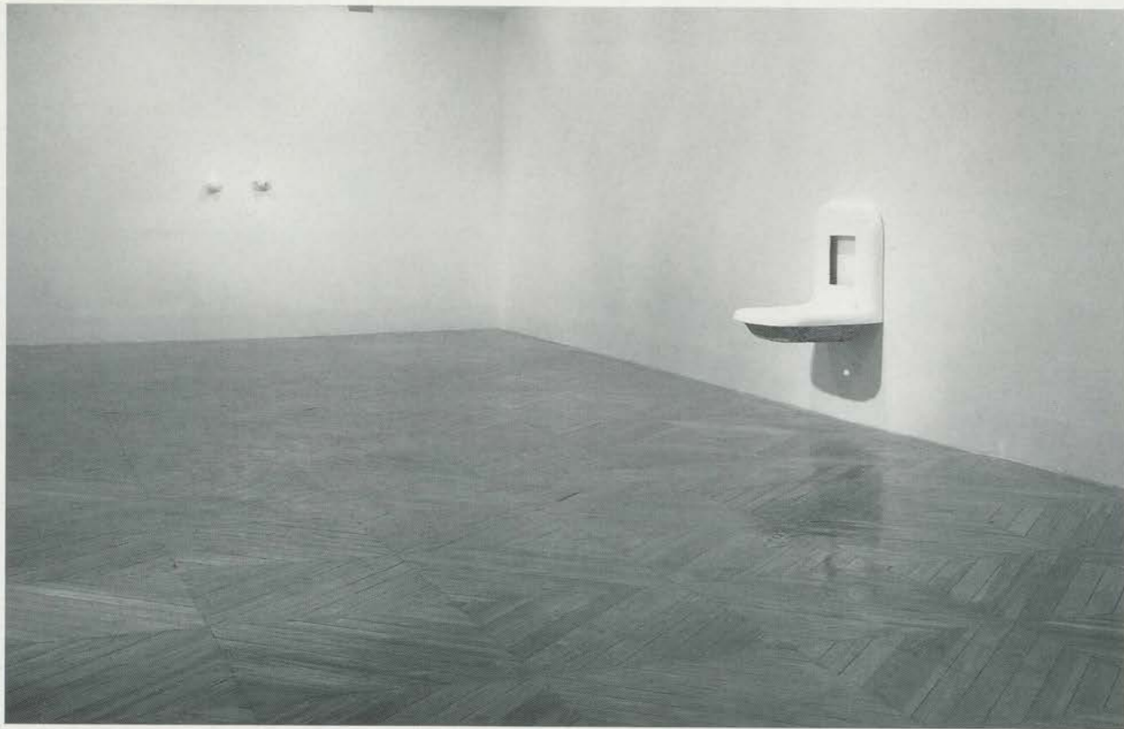
ROBERT GOBER, INSTALLATION, GALERIA MARGA PAZ, NOVEMBER 1990.