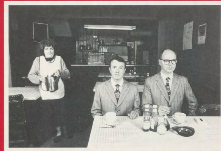
GILBERT & GEORGE AT THE MARKET CAFÉ, LONDON 1987